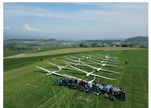
Erinnerung an 2023